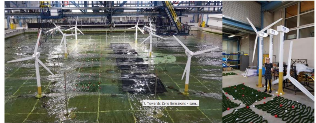
Multi-use van windturbineparken: zeewierkweek en drijvende zonnepanelen