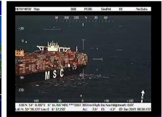
Op 2 januari 2019 verloor de MSC Zoe meer dan 300 containers boven de Nederlandse Waddenkust.